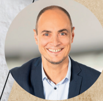
6 GEBIET SÜD / WEST

Unser ganzes Produktsortiment und Rezeptideen finden Sie auf www.frischli- foodservice.de