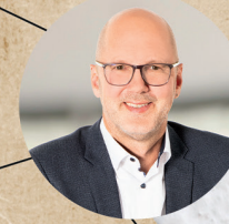
7 GEBIET SÜD / OST