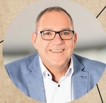
5 GEBIET MITTE / WEST