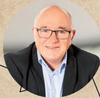
3 GEBIET WEST