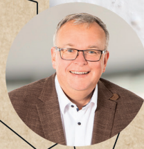
2 GEBIET NORD