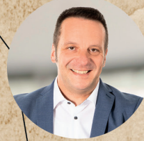
4 GEBIET MITTE / OST