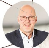
7 GEBIET SÜD / OST