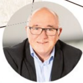
3 GEBIET WEST