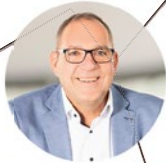
5 GEBIET MITTE / WEST