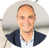
6 GEBIET SÜD / WEST