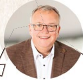
2 GEBIET NORD