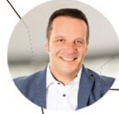
4 GEBIET MITTE / OST