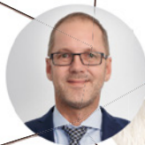
7 GEBIET SÜD / OST