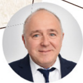
3 GEBIET WEST