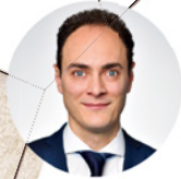
6 GEBIET SÜD / WEST