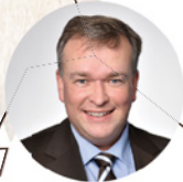
2 GEBIET NORD