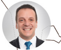
4 GEBIET MITTE / OST