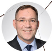
5 GEBIET MITTE / WEST